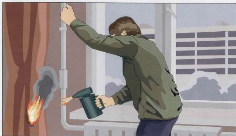
Отогревание замёрзших труб паяльными лампами и факелами