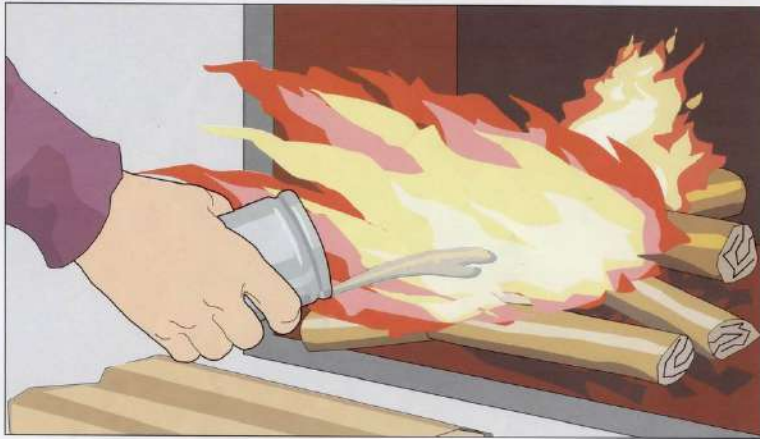
Применение для розжига печей легковоспламеняющихся и горючих жидкостей, выпадение углей, трещины в кладке, возгорание сажи в дымоходах