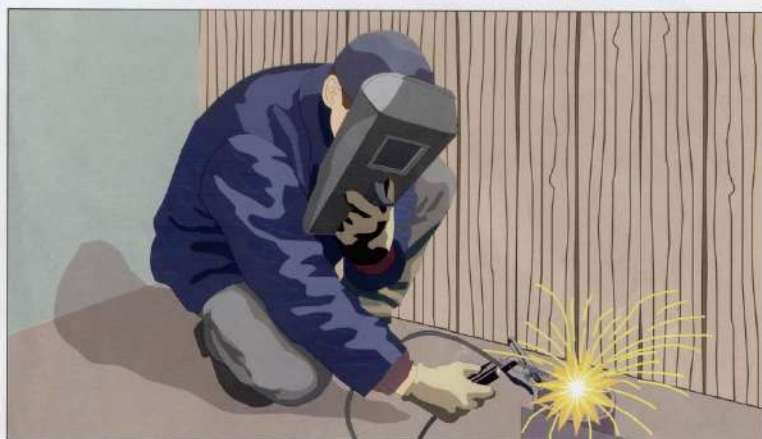
Нарушение правил проведения сварочных работ